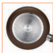
Base amb disc d'inducció d'acer inoxidable