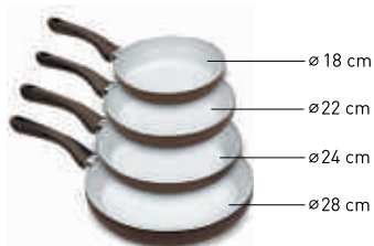
Set de 4 paelles amb acabat marró mat

Retalla 25 cupons dels 30 que es publicaran de dilluns a divendres a La Vanguardia, del dilluns 16 de maig al divendres 24 de juny.