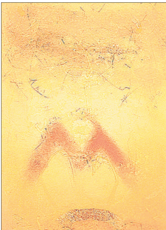
Globus VI. Gravats original de Masafumi Yamamoto datat el 1992

L'entrada al món de Yamamoto succeeix principalment a través del color, i també a través d'una profunditat virtual que l'artista sap realitzar i suggerir mitjançant superposicions successives en un rectangle o quadrat de paper. El que ofereix l'obra de Yamamoto és un regal que només poden obtenir els qui estiguin disposats a una veritable contemplació: pausada, oberta, sense prejudicis. L'obra és un acte silenciós d'admiració i significa una celebració del millor, de la bellesa i la llibertat, del costat lluminós de l'existència, tant com una accep-